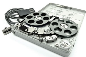
RADIOWY I ELEKTRONICZNY SPRZĘT WYWIADOWCZY