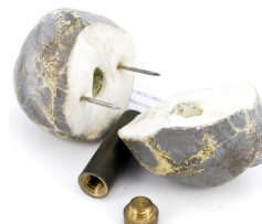
SKRYTKI I KONTENERY