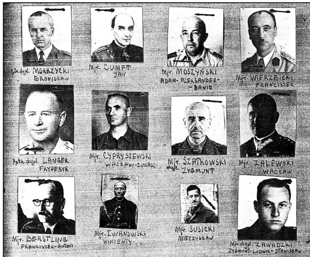
„Schemat organizacyjny” Ekspozytury ESWU Oddziału Informacyjnego Sztabu II Korpusu.