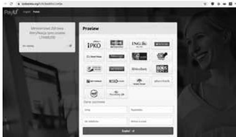
Grafika 5. Print screen z portalu Zaufana Trzecia Strona.