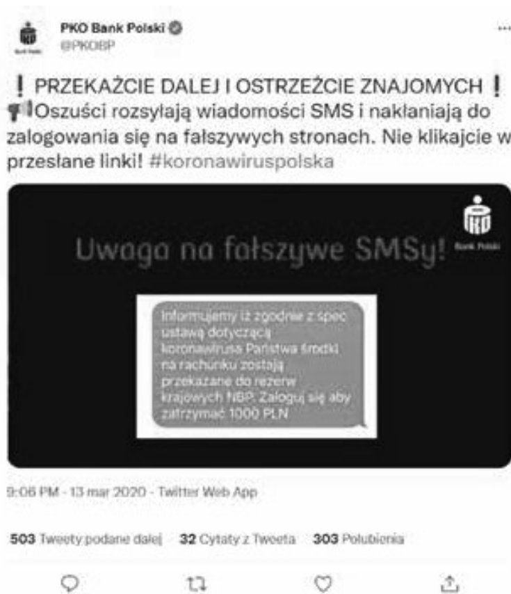
Grafika 4. Print screen z konta PKO Bank Polski na portalu społecznościowym Twitter.