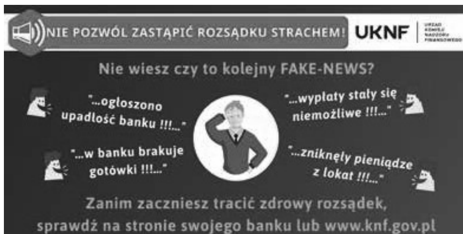
Grafika 7. Print screen z konta Urzędu Komisji Nadzoru Finansowego na portalu społecznościowym Twitter.