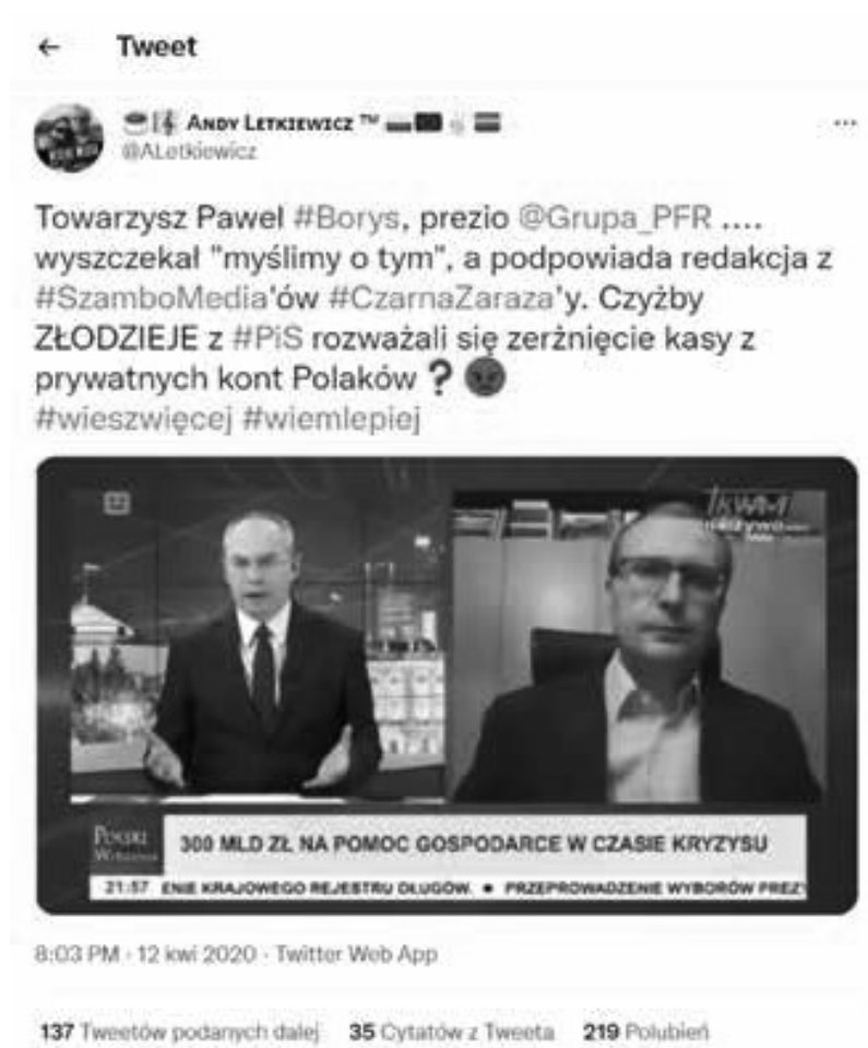
Grafika 1. Print screen z konta na portalu społecznościowym Twitter.

falszywych wiadomości, które – o czym mowa dalej – zostały wykorzystane m.in. przez dziennikarzy, polityków oraz portale informacyjne.