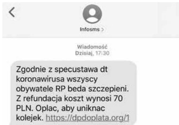
Grafika 6. Print screen z portalu Zaufana Trzecia Strona.

Tego samego dnia pojawiła się jeszcze jedna kampania, której celem było wyłudzenie pieniędzy od klientów banków (grafika 6).