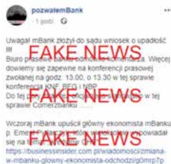
Graphic 2. Print screen from a social media account on Twitter.