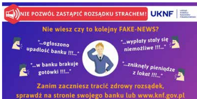
Grafika 7. Print screen z konta Urzędu Komisji Nadzoru Finansowego na portalu społecznościowym Twitter.