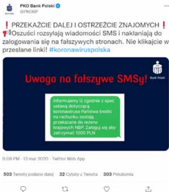
Grafika 4. Print screen z konta PKO Bank Polski na portalu społecznościowym Twitter.