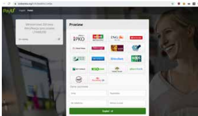
Graphic 5. Print screen from the Zaufana Trzecia Strona website.