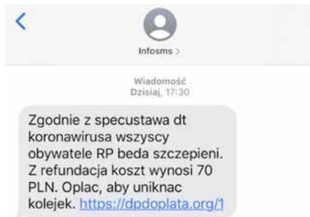
Graphic 6. Print screen from the Zaufana Trzecia Strona website.

On the same day, another campaign emerged to defraud bank customers (graphic 6).