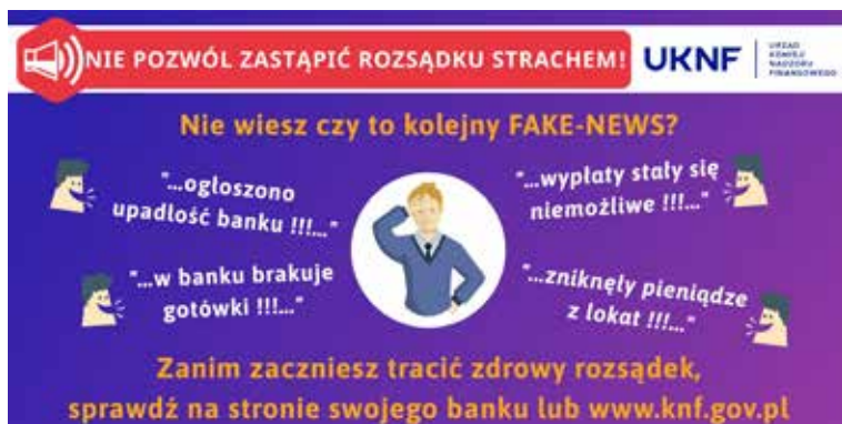
Graphic 7. Print screen from the Twitter account of the Office of the Financial Supervision Authority.