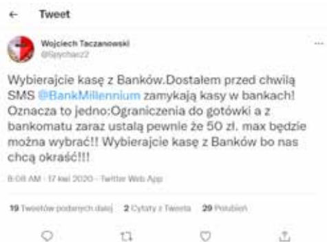
Graphic 3. Print screen from a social media account on Twitter. Fake news regarding cash withdrawal restrictions at Millennium Bank.

The last type of information disseminated with great frequency in times of the epidemic threat is fake news about problems with cash availability at ATMs and bank branches. To fairly describe the phenomenon under analysis, it must be acknowledged that indeed - due to the restrictions imposed, the scale of cash withdrawals, and the fact that banks were also experiencing staff shortages due to the COVID-19 pandemic, there were temporary problems with timely delivery of cash to ATMs. However, this had nothing to do with the reasons indicated in alarmist posts made on social media. However, every now and then, new information appeared on the web that there would be a shortage of cash due to the pandemic (graphic 3).