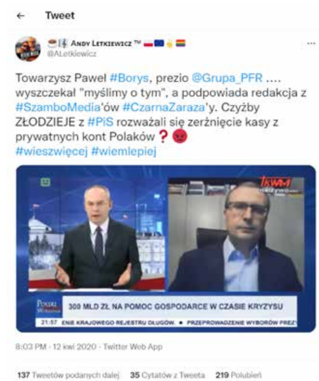
Graphic 1. Print screen from a social media account on Twitter.

private accounts of Poles? 60 (graphic 1). The tweet gets 150 “follows” and 236 likes. According to the content of the tweet, the government’s goal is to “steal money from the private accounts of Poles.” This information triggered an avalanche of further fake news, which, as we will discuss later, was used by journalists, politicians and news portals, among others.