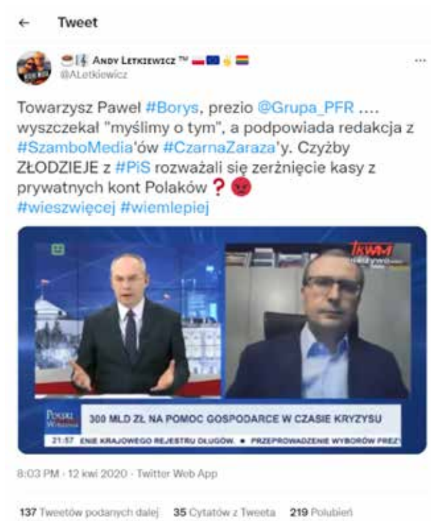
Grafika 1. Print screen z konta na portalu społecznościowym Twitter.

fałszywych wiadomości, które – o czym mowa dalej – zostały wykorzystane m.in. przez dziennikarzy, polityków oraz portale informacyjne.